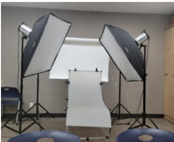
실습 시 촬영 세트장