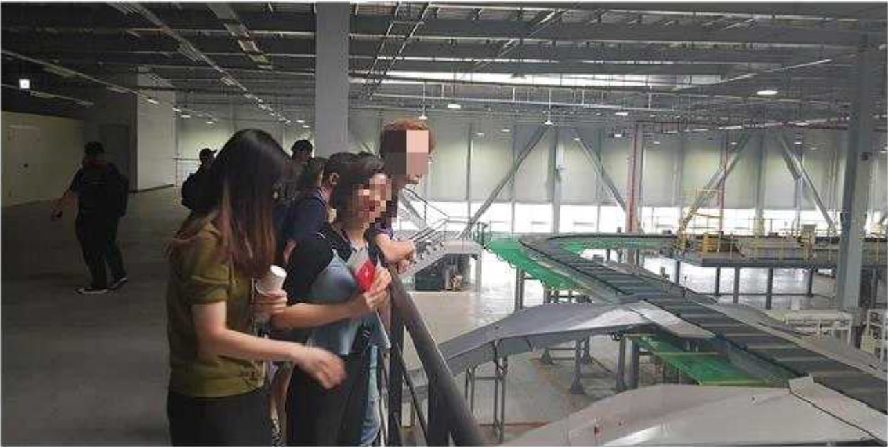
<인천공항세관 특송화물 분류 라인 현장 방문>