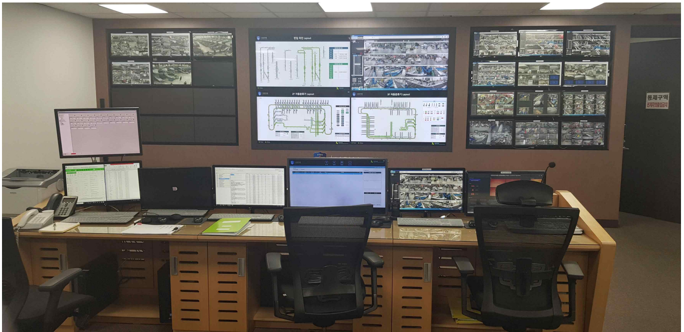
<인천공항세관 특송화물통관품 모니터링>