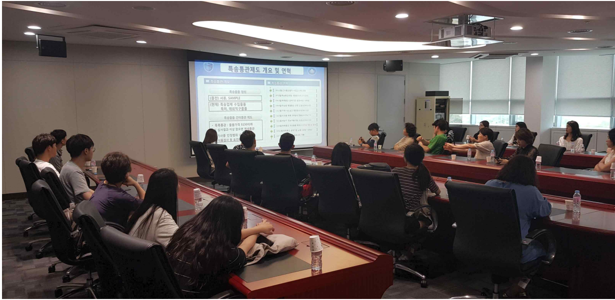
<인천공항세관 방문 : 특송화물통관 특강>