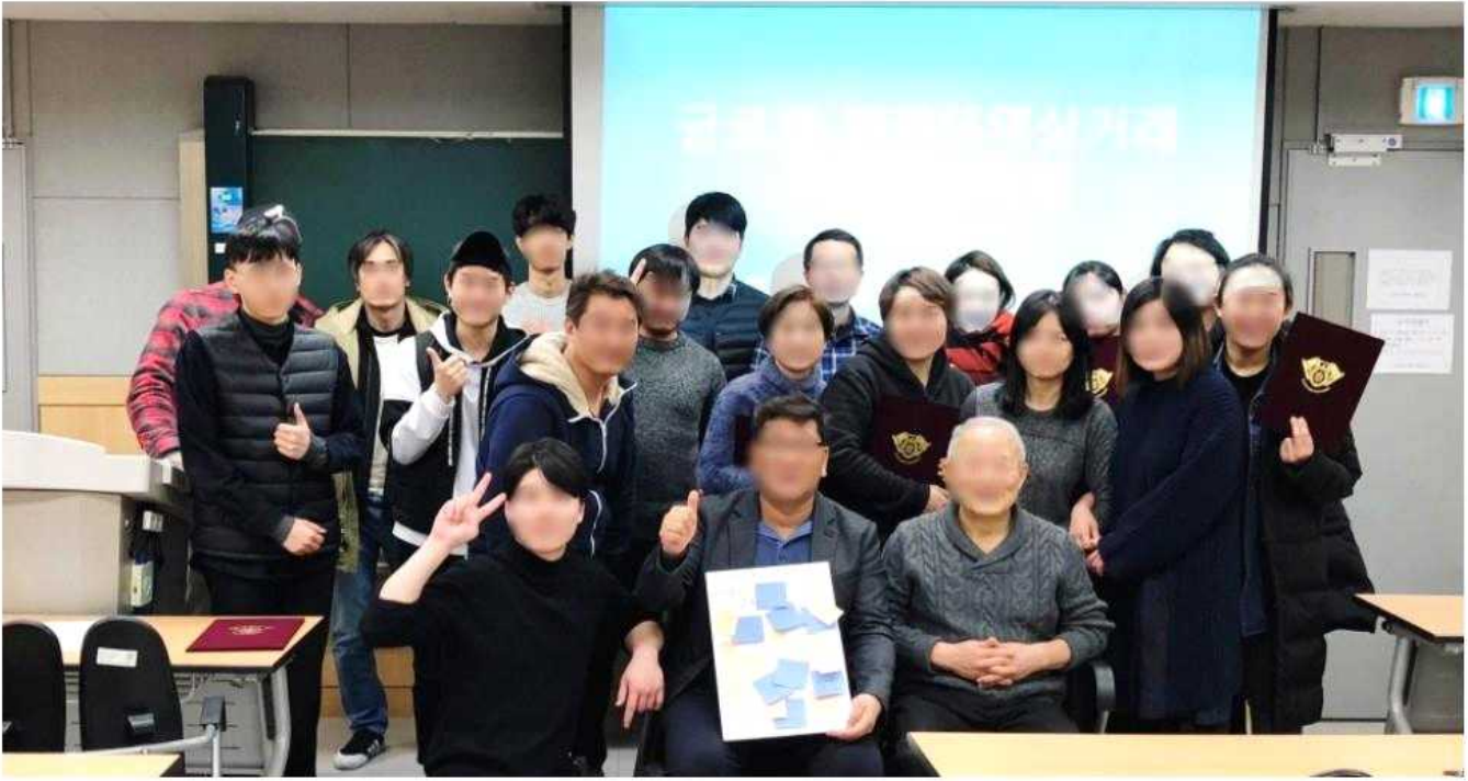
전자상거래 무역&물류 과정을 마친 수료식 모습