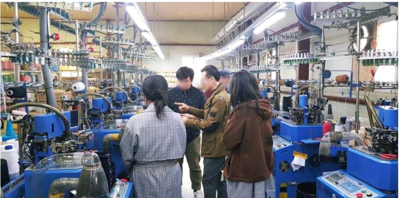
현장에 대한 이해를 위해 업체 방문을 통해 학습하는 모습