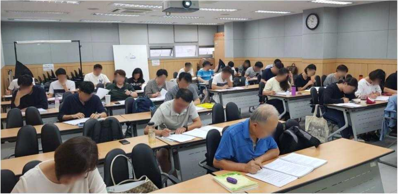
전문가를 통해 자신의 창업 계획서를 검토하는 모습 (정부지원자금 : 5천~ 1억)