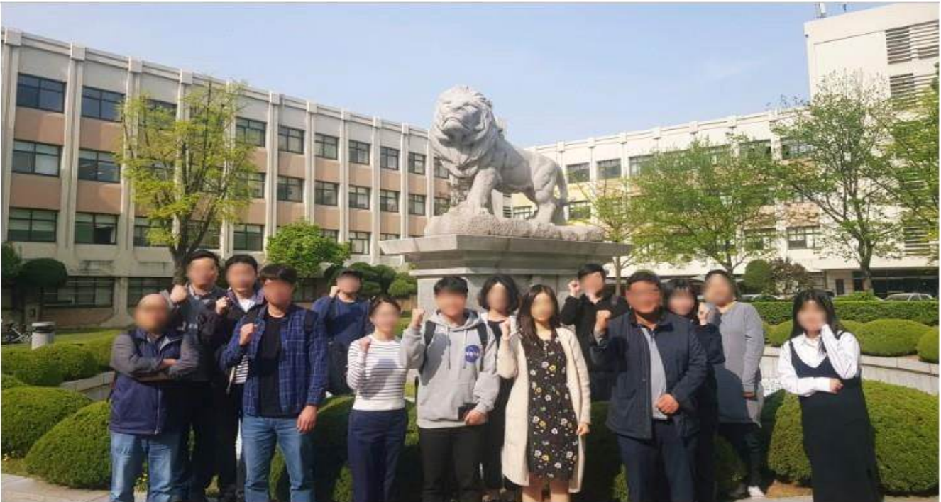
2019 융복합전자상거래 무역&물류 수강생들의 모습

경희대학교 글로벌 미래 컴퍼스에서 창업을 고민하시는 실업자와 창업 희망자들을 위해 <융복합전자상거래 무역&물류 창업과정>을 진행합니다!