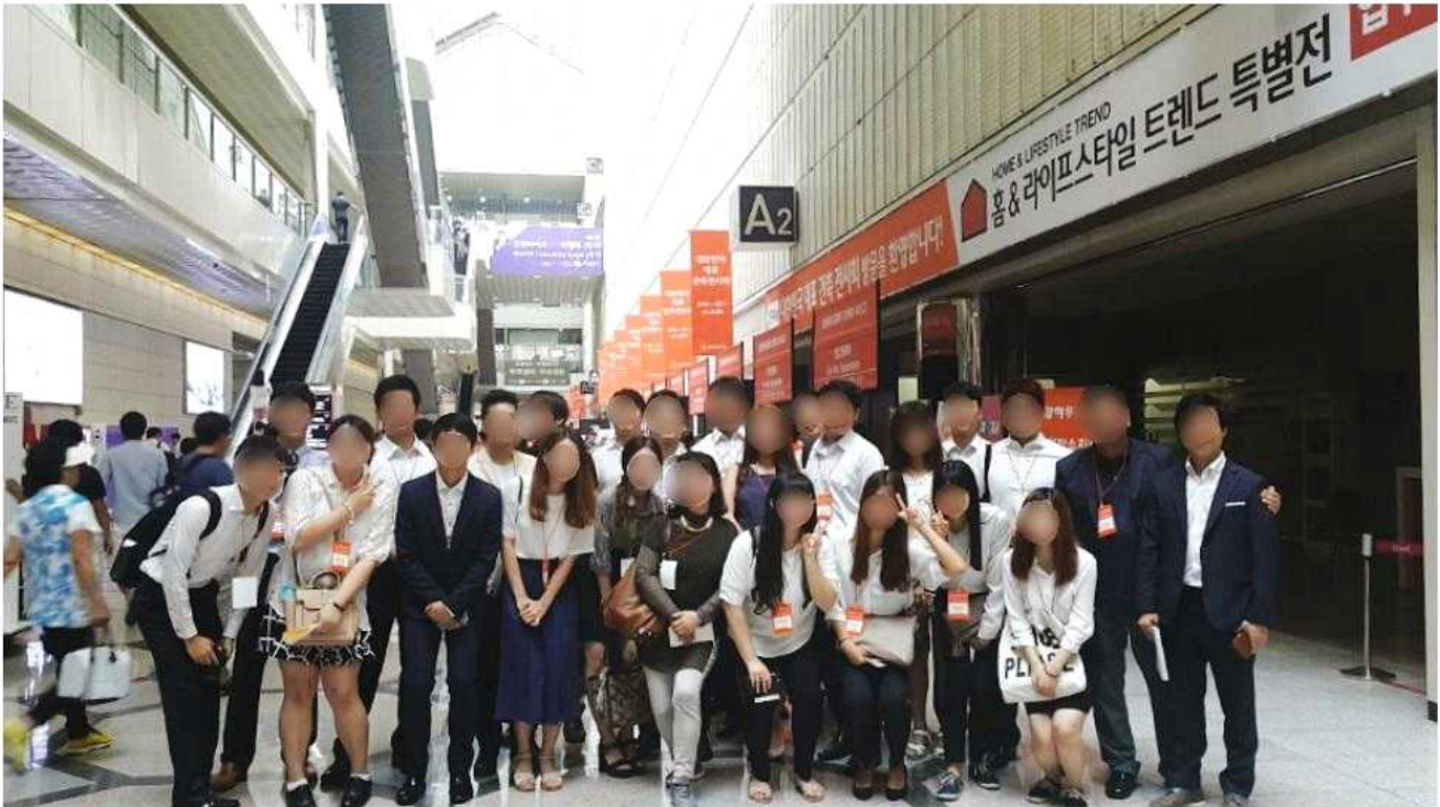
박람회를 통해 현 시장의 트렌드를 배우고 학습하는 모습