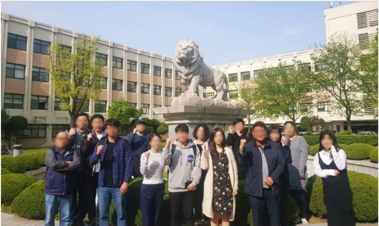
2019 융복합전자상거래 무역&물류 수강생들의 모습

경희대학교 글로벌 미래 컴퍼스에서 창업을 고민하시는 실업자와 창업 희망자들을 위해 <융복합전자상거래 무역&물류 창업과정>을 진행합니다!